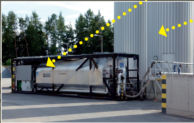
3 Смесительное оборудование