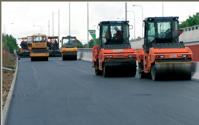
6 Укладка слоя