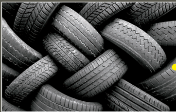
1 Подержанные шины